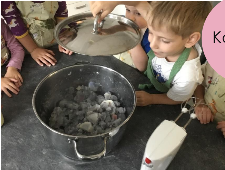
lila Kartoffel- brei