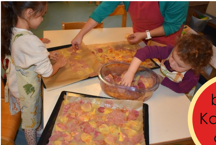
bunte Kartoffel- chips