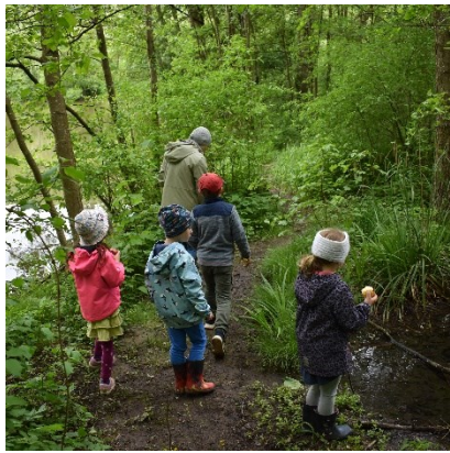
Insel auf dem See

Ein Naturerlebnistag für die künftigen Schulkinder mit Geschichten von der Wichtelwiese, einer verborgenen Kapelle mit einem kleinen Glockenturm, vielen Nacktschnecken, Rehwildfährten, warmen Leberkäse und kleinen Blässhuhnküken, die Schwimmen lernten.